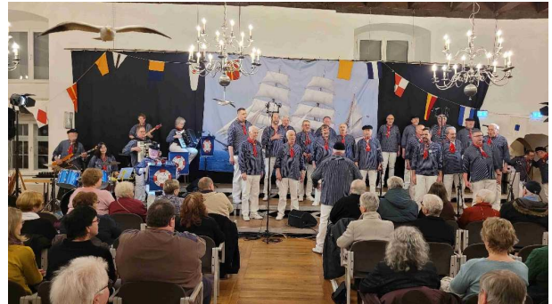
Shanty-Chor der Marinekameradschaft Göttingen