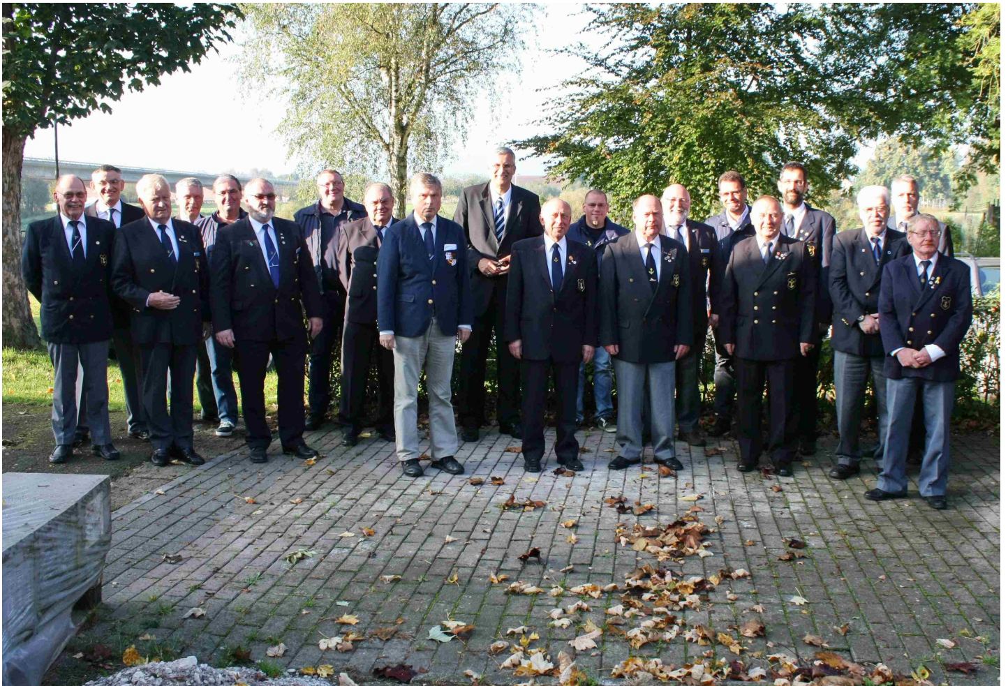
LV-Arbeitstagung Holzminden 27.09.2014