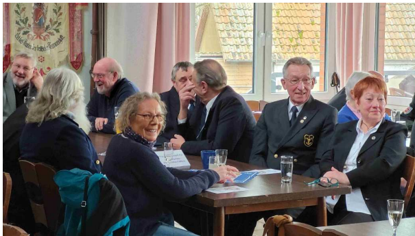
Abordnungen des Polizeichors und der Marinekameradschaften Borken (Hessen), Gotha und Kreiensen