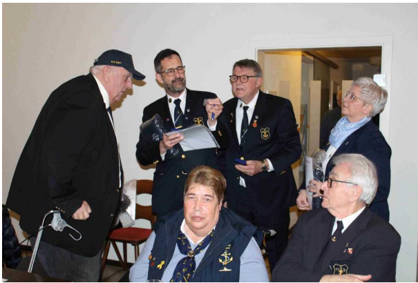
Eine goldene Treuenadel für 60 Jahre sieht man nicht so oft