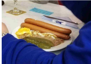
Text: Manfred Eichholz

Auch mit dieser soliden Grundlage kann man einen feucht fröhlichen Herrenabend gestalten. Die Stimmung, Gesprächsstoff und Ausdauer waren bemerkenswert. Erst um vier Uhr des Folgetages wurden die Tore geschlossen.