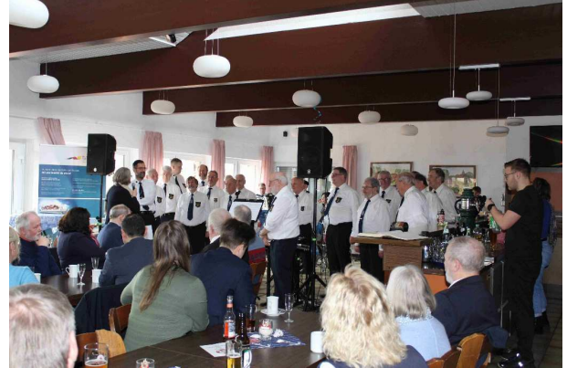
Der Shanty-Chor sorgt für maritime Stimmung