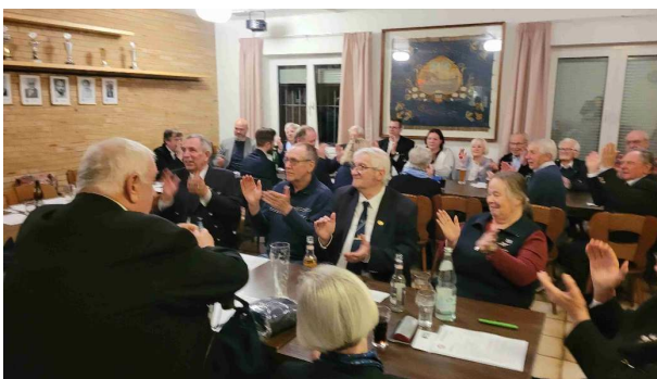
Kutterläufer für die Geehrten