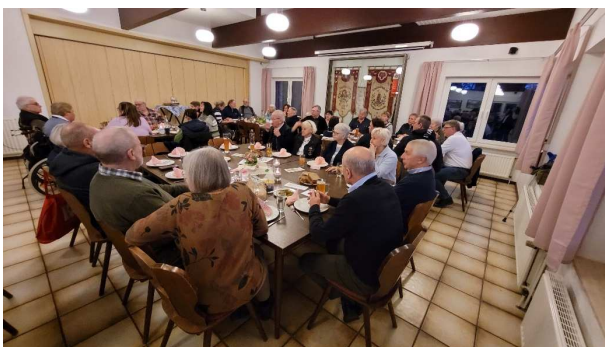
Gut besuchtes Essen