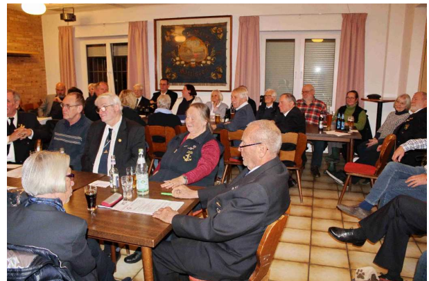
Platz ist in der kleinsten Hütte