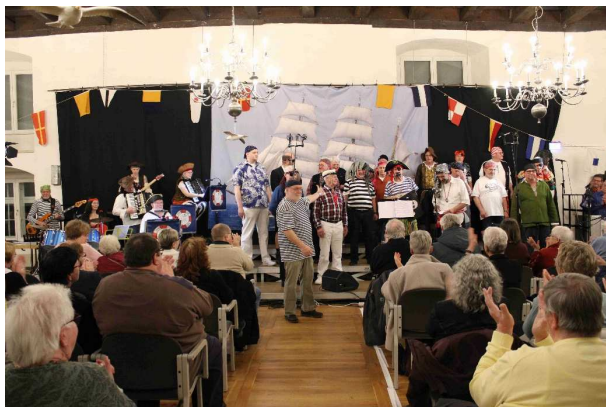
Shanty-Chor der Marinekameradschaft Göttingen