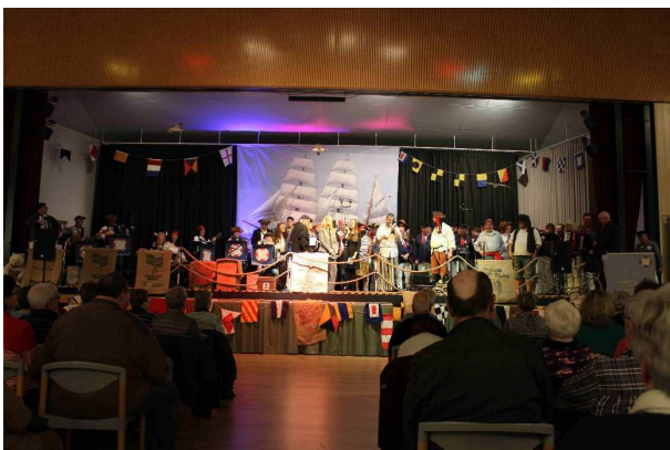
Alle drei Chöre gemeinsam