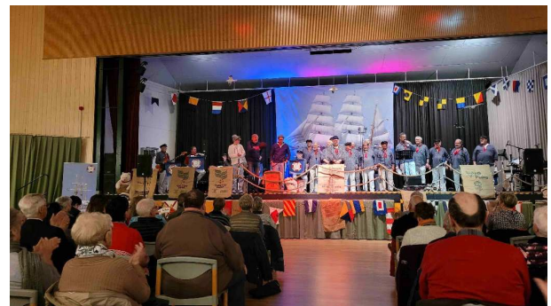
Shantychor der MK Göttingen