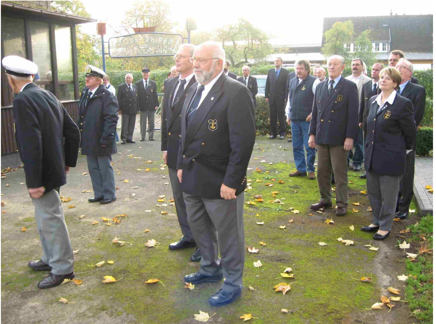
LV-Tagung Holzminden 18.10.2008